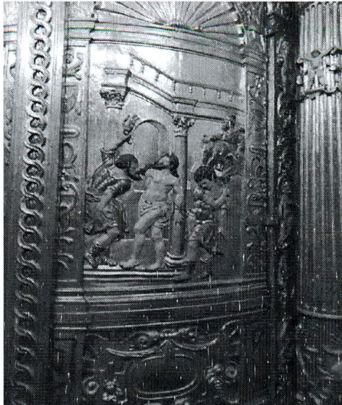
Jesús de la columna de Guillermo de Orta en tabernáculo del Sagrario de la Santa Iglesia Catedral de Córdoba

Las fuentes orales nos informan que la imagen de la Virgen de la Esperanza se procesionaba todos los años en la festividad de la Candelaria, para esta salida colocaban una efigie del Niño Jesús en sus manos y a los pies depositaban dos pichones y una torta de afrecho.