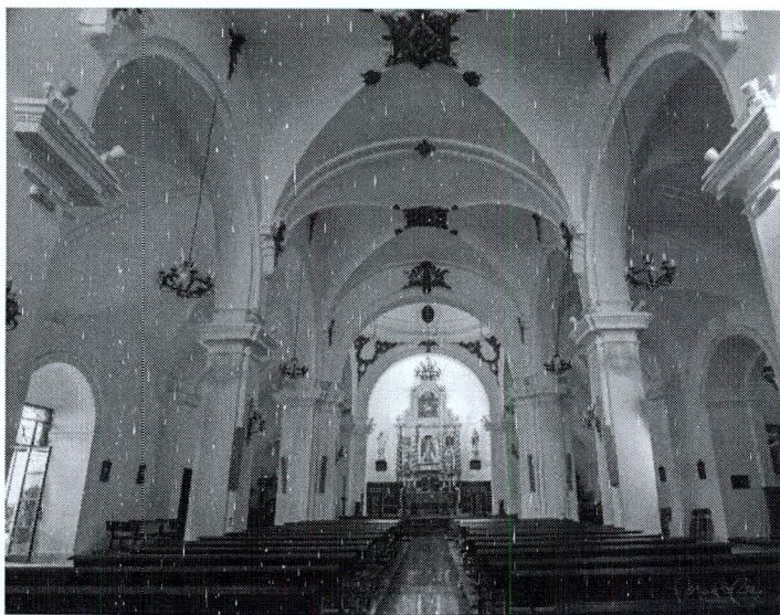
Vista interior de la Parroquia.

los años anteriores. La asignación del párroco son 1.125 pesetas, de cuya cantidad hay que rebajar el catorce por ciento para el Estado y lo que reduce el habilitado por cobranza. Los emolumentos que anualmente percibe por derechos de estola y pié de altar ascienden aproximadamente a unas 600 pesetas 90 .