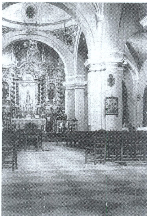
Interior de la Parroquia en el primer tercio del siglo XX

Las citas anteriores ponen de manifiesto que sin duda se trata del altar mayor de la parroquia y que en ese lugar se veneraba el Santísimo Sacramento, probablemente porque aun no se había construido la capilla del Sagrario y Ánimas de la que nos ocuparemos más adelante. Siguiendo el criterio de don Enrique Ayllón comenzamos describiendo hasta donde las fuentes consultadas nos permiten los altares y capillas situadas en el lado del evangelio.