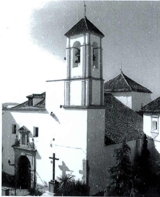
La Parroquia de Santa Marina de Aguas Santas de Villafranca

Asimismo, hemos examinado el Archivo Municipal de Villafranca y el Histórico Provincial de Córdoba. De nuevo lamentamos la desaparición del Archivo parroquial que nos hubiera enriquecido con su información el presente trabajo. Como apoyatura bibliográfica hemos consultado el libro “Villafranca de Córdoba. Un señorío andaluz durante la Edad Moderna”. Por último nos han sido provechosas las fuentes orales de las que hemos ido recopilando datos a través de entrevistas a nuestros mayores.