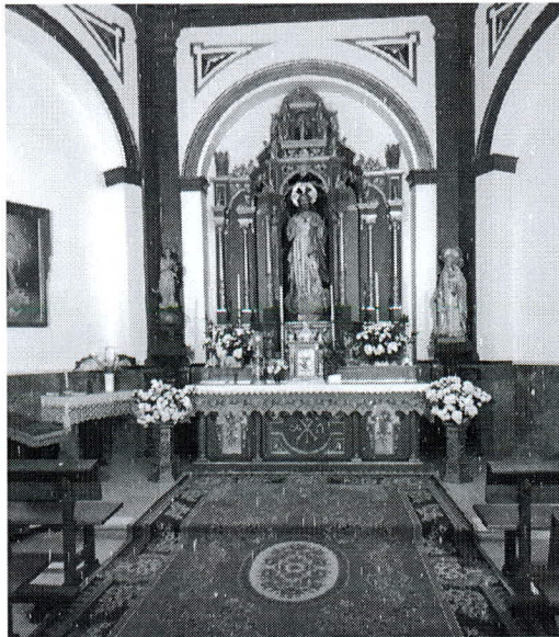
Capilla del Sagrario en la actualidad

Era de estilo barroco y en el centro estaba la imagen de San José con el Niño, ambas de de madera tallada. La de Jesús lucía tres potencias de plata y la Santo Patriarca una diadema del mismo metal, además sostenía en sus manos un paño bordado en oro y una vara con flores de plata. Posiblemente, se trataba de la efigie que adquirió el concejo en 1760 para sustituir otra más antigua 32 . Completaban este altar dos candeleros de metal con un crucifijo, y dos pares de manteles 33 .