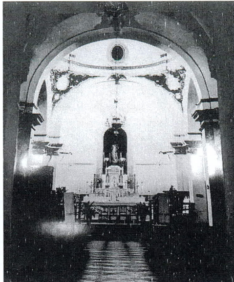
Altar Mayor de la parroquia en los sesenta del siglo XX.