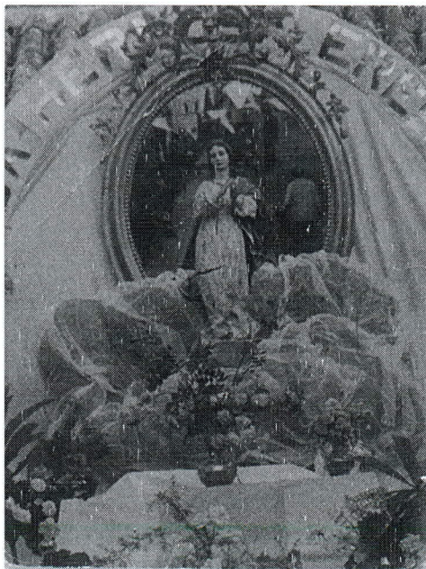
Altar de la Inmaculada en calle Ayllón Cubero con motivo del Año Mariano (1954)