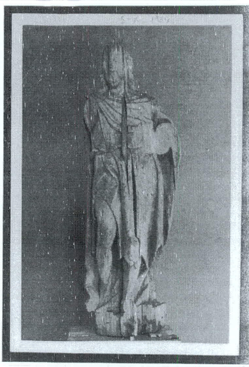
Estado de la imagen de San Juan Bautista.