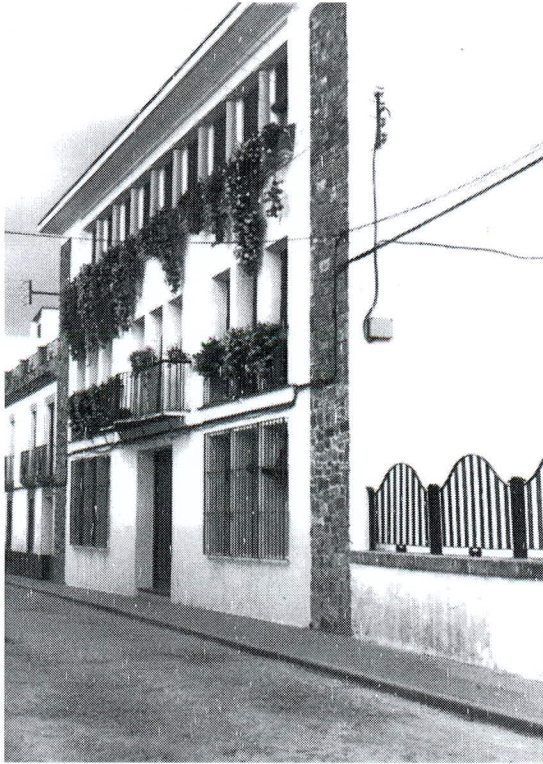
Fachada de la Escuela Hogar Nuestra Señora de los Remedios.

El problema se solucionó con los pocos ahorros que disponía la parroquia, que se aumentaron con limosnas de los villafranqueños, dinero procedente de la lotería parroquial, de lo recaudado en teatros o nacimientos vivientes, etc. Por fin, aunque faltando algunos detalles, se terminaron las obras y cuando el centro comenzó a funcionar don José Leal dejó en manos de seculares la dirección y administración del mismo. Los primeros alumnos llegaron en el curso 1969-1970, y su número era de 80, 40 niños e igual número de niñas procedentes de población diseminada, dándoles la oportunidad de que salieran del analfabetismo al que estaban condenados. El elevado número de solicitudes propició un aumento de 40 plazas más, que añadidas a las iniciales sumaban 120.