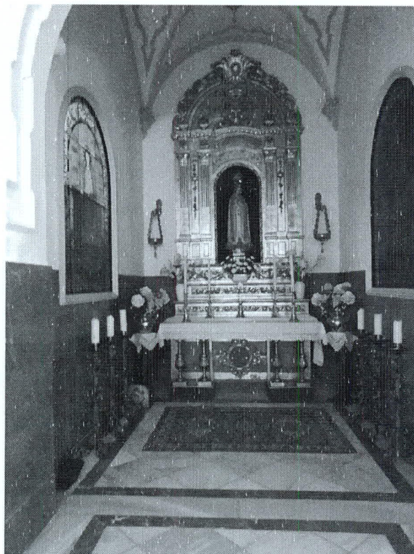
Capilla de Nuestra Señora de Fátima

El desolador panorama que nos ofrece el sacerdote informante difícilmente podía cambiarlo sin una eficaz ayuda; en 1950 contaba 82 años y escribe al obispo exponiéndole que aunque su estado general era bueno, sufría con frecuencia mareos que le impedían el rezo del Santo Oficio 114 . A su avanzada edad había que unirle el desgaste de los alrededor de 60 años de sacerdocio, de los cuales algo más de 40 había sido párroco de su pueblo natal; el fracaso de muchos de sus proyectos y todos los avatares del tiempo de la II República y de la guerra civil justificaban de sobra el estado físico y psíquico en que se hallaba.