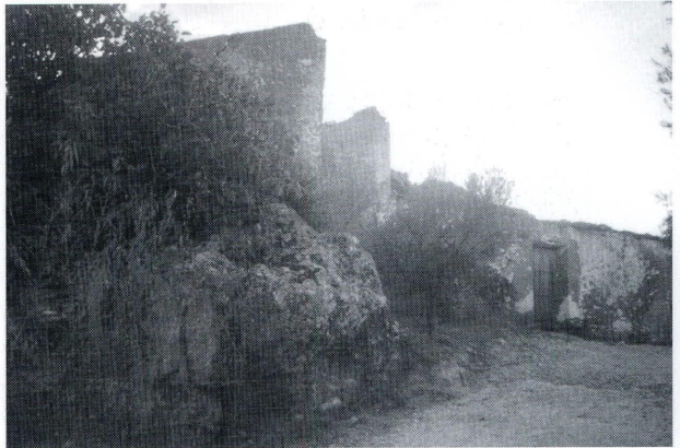
Lám. II. Cortijo de Peñalosa

El citado cortijo se ubica a Sudeste del Cerro de Las Cabezas , junto al camino que, partiendo de Fuente-Tójar, circunda al Cerro en dirección a la aldea de La Cubertilla . El topónimo le viene dado debido a un gran peñasco que hay al Norte de la vivienda formando parte de sus paredes (lám. 2). La casa, de construcción moderna, es una de las muchas dispersas en la zona adscritas a la mencionada aldea de la que dista seiscientos metros. Es de buena fábrica, con dos niveles de varias estancias y elementos decorativos en sus alacenas y armarios empotrados. Los tejados se disponen a dos aguas con el entramado de vigas a manera de “pie de tijera”. Posee patio interior, pajar, establos, zahúrdas y otras