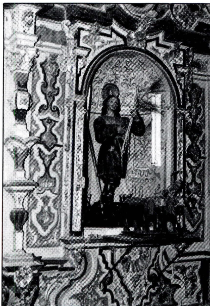
S. Isidro, sus bienes y vista parcial del retablo.

Pasarán bastantes años en los que no se hagan los asientos de bienes. No por eso, las posesiones del Santo o de la Hermandad se van a ver afectadas, bien por la sustitución de unos objetos por otros, o bien por la adquisición de nuevas prendas, como señalan los mayordomos de S. Isidro al presentar el estado de cuentas al Cura, D. Francisco Antonio Cabrera, el día 21 de mayo de 1769: “Zien R. s V. n Ymporte de Una Yjada de plat que SE arrenobado al s. to ” (3) y “Cuatrocientos Cuar. ta R. s V. n Ymporte de Una bandera de tafetan de piezas de Divercos Colores Conla lamina DIS r S. n YSidro”.