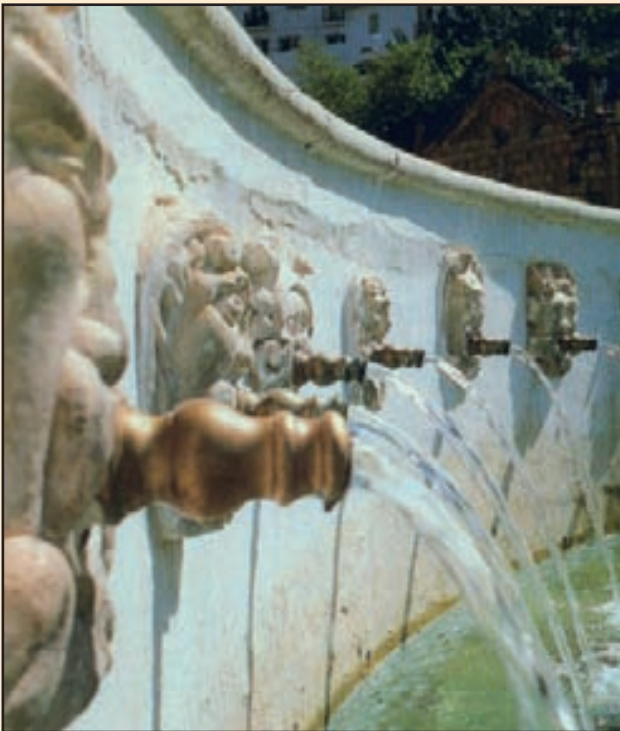
Priego: La Fuente del Rey

Lo cierto es que la inclusión de Alcalá-Zamora entre los académicos de la lengua fue muy criticada por la oposición y por la prensa reaccionaria. La candidatura del mismo fue presentada en varias ocasiones, pero no se consolidó hasta la fecha antes señalada. Según recuerda en sus Memorias 4 , parece ser que hubo varias ocasiones de propicio ambiente en la docta institución para que el prieguense fuera nombrado académico, como ocurre en el otoño de 1926, pero el dictador Primo de Rivera se opuso a ello junto con el ministro de Instrucción Pública, Eduardo Callejo; entonces se