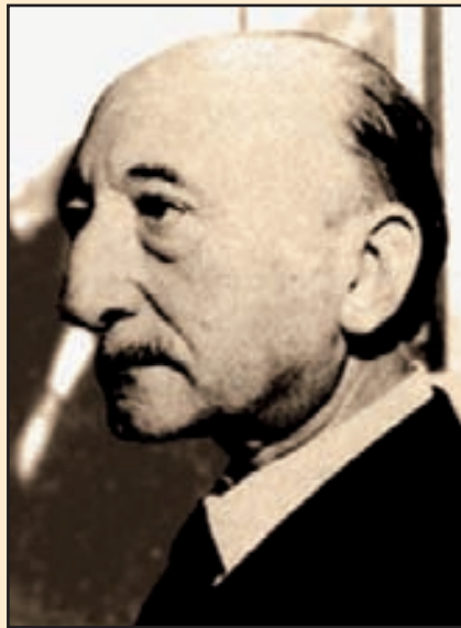
Wenceslao Fernández Flórez

No podían faltar en el texto algunas referencias al prieguense don Niceto Alcalá-Zamora y es, precisamente, un acto que se atribuye a éste el que motiva toda la acción novelesca. El detective Ring, el protagonista, recibe un aviso para entrevistarse con el excelentísimo señor ministro de Relaciones Extranjeras y en la entrevista se pone de relieve que una serie de personajes misteriosos conspiran contra un estado europeo. Es preciso averiguar quiénes son y qué se proponen. El detective se disfraza y una noche de abril de 1934 2 consigue asistir a una reunión, cuya entrada le franquea el pronunciar una palabra española: ¡Paralelepípedo! Los que asisten a esta conjura son todos profesores de español, venidos de diversos lugares de Europa, que plantean un pleito de carácter profesional: “Se trata -dice el presidente de la reunión- de que podamos vivir o de que hayamos de morirnos de hambre abandonados uno a uno por nuestra clientela”. Los profesores de español se quejan de que “la lengua castellana se está