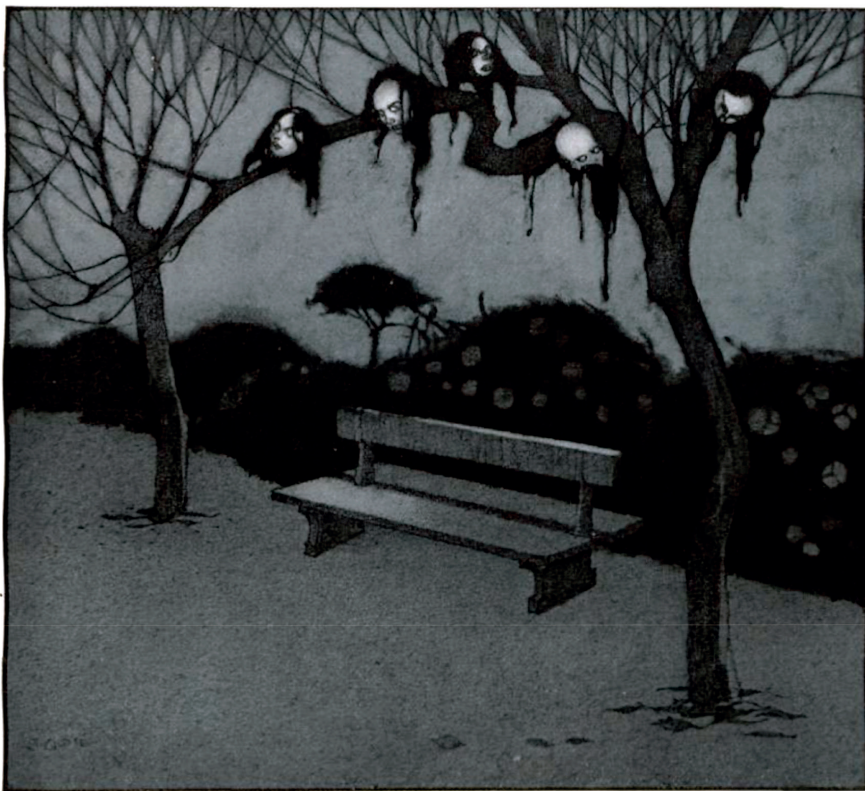
... vi que quien gritaba era uno de los árboles coposos, lleno de cabezas por frutos.