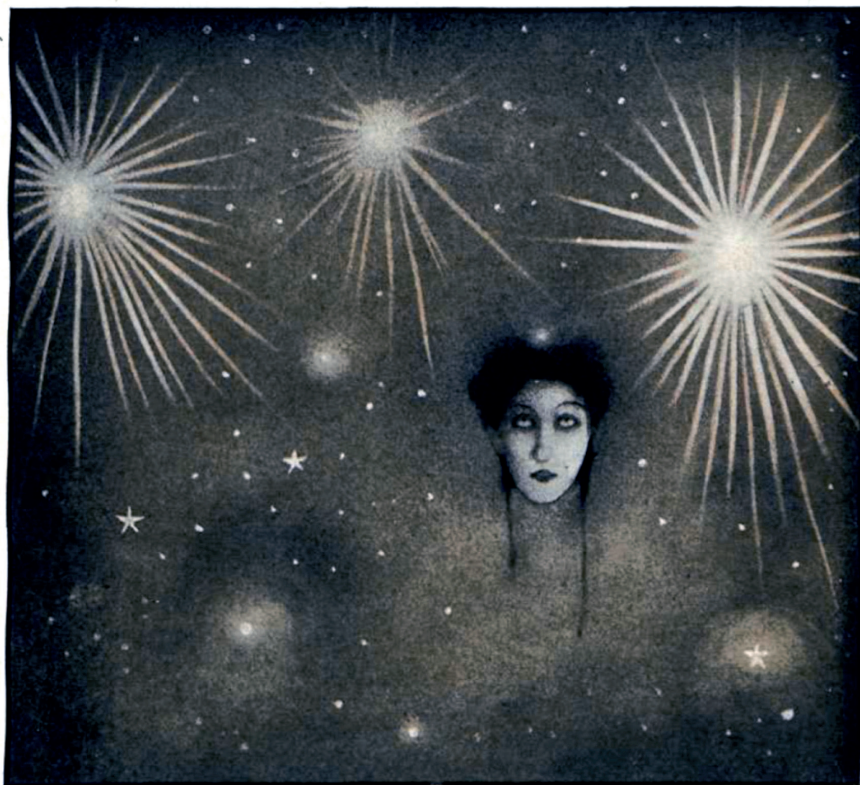
... tres estrellas brillan en la extremidad, pero la que está en la punta es la mayor y más resplandeciente.