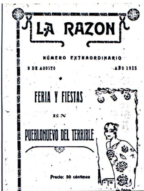
F 4 Extra de Feria de LA RAZÓN 1925