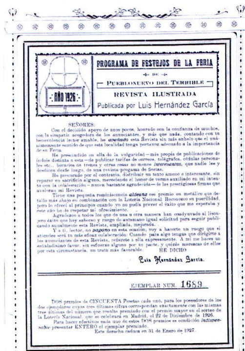
F 5 Revista ilustrada de Feria agosto 1926