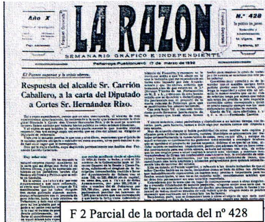
F 2 Parcial de la portada del nº 428

Aunque no pueda precisarse, hacia 1931 se produce un cambio de formato, que pasa a ser de tamaño tabloide, y de cabecera en la que se mantiene en general el logotipo, bajo el que aparece Peñarroya-Pueblonuevo junto a la fecha de publicación del semanario, sin adscribirse como republicano. Los precios de suscripción ascienden en 1932-33 a 2 pesetas el trimestre en la Ciudad y 4,80 y 7,50 respectivamente al semestre en provincias y en el extranjero, lo que indica una mayor difusión de la publicación, cuya redacción, administración y talleres de tipográficos seguían en el 36 de la calle Miguel Vigara —que se dedicará al periodista republicano José Nakens en 1932— donde de la Corte había montado su propia imprenta 6 . En las cuatro páginas, a cuatro columnas aparecen, como novedad las esquelas y en ocasiones, editoriales como tales en su primera página. La vida municipal y política aumenta sus contenidos, estando sus páginas abiertas a partidos y sindicatos locales de todas las tendencias y a otros colectivos sociales, así como a las colaboraciones enviadas desde las distintas corresponsalías, mientras disminuyen drásticamente los literarios — del espejeño Fernando Félix, casi siempre, o el folletín “La fatalidad de Ofelia Celsi” del socialista