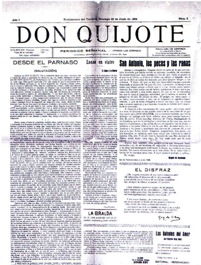
F 6 Portada DON QUIJOTE. 22-6-1924. nº 3