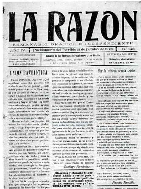
F 1 LA RAZÓN, portada del 21-10-1926

En los casi tres lustros que abarcan esta etapa que consideramos, el número de publicaciones periódicas de la que se va a convertir en Ciudad de Peñarroya-Pueblonuevo en 1928 disminuye con respecto a los anteriores períodos y, aunque siguen predominando las cabeceras adscritas a sindicatos o partidos políticos, con excepción de las de ideología anarcosindicalista, muy perseguida durante la Dictadura primorriverista y totalmente ausentes durante la República, será LA RAZÓN, el primer semanario generalista gráfico, conservador e independiente que expresaba sus objetivos en un prolijo subtítulo en el que se proclamaba " Defensor de los intereses de Pueblonuevo y su distrito: Literatura, Arte, Ciencia, Deporte y cuanto atañe a esta cuenca minera y su provincia " y que, a lo largo de sus casi once años de vida se convertiría en la publicación más influyente y respetable entre los monárquicos, primero, y después entre los republicanos que de alguna manera conformaron la ahora llamada "Tercera España" infelizmente aplastada por los odios e intransigencias de las otras dos Españas machadianas, pues en sus páginas los temas y las opiniones de las personas se confrontan en general dentro de la corrección, del respeto y la ironía, lo que es uno de los aciertos en el haber de esta publicación en la que en ocasiones también hay acritud. 1