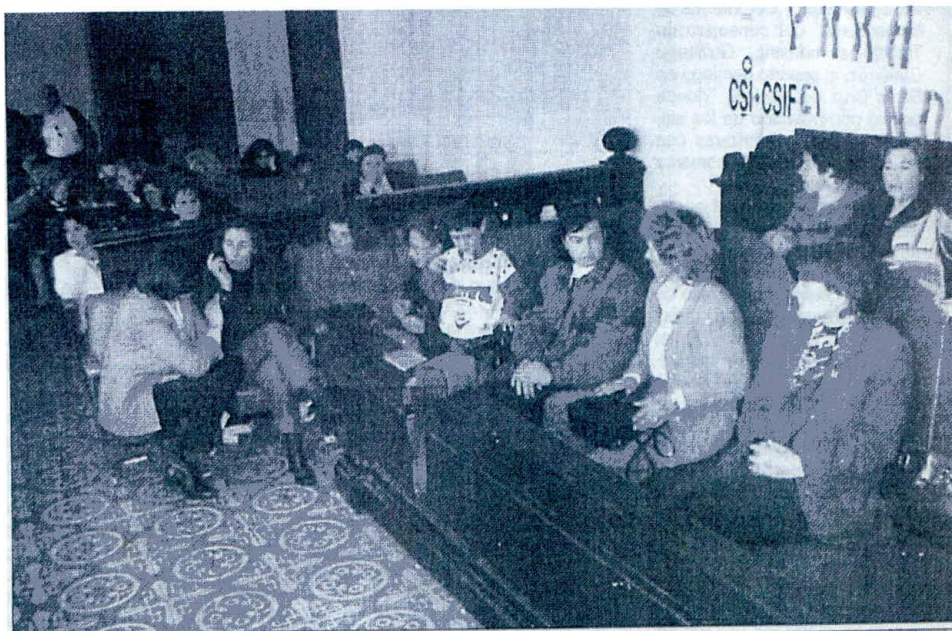
Asamblea de mujeres en el Ayuntamiento peñarriblense (Alberto Díaz).

El martes 2 la etapa hacia Manzanares, en donde cortarían la N-IV, sigue envuelta en la polémica de la agresión, que volvieron a condenar los sindicatos. El PSOE suspendía la reunión prevista con el Comité debilitando las negociaciones con ENCASUR y acusaba a Molina de aspirar a la alcaldía en las municipales, cosa que este negó afirmando que no se presentaría a las elecciones pues «lo mío es el sindicalismo». Los parlamentarios socialistas acusaban a la «pinza PP-IU» de traicionar a la comarca, aunque ambos grupos parlamentarios, al día siguiente, respaldaron en el Congreso «las aspiraciones legítimas y razonables» de los mineros que caminaban hasta Villalta de San Juan, siendo reforzados en el corte realizado en la autovía por mineros desplazados desde el centro de ENCASUR de Puertollano. 300 personas habían vuelto a cortar la N-432 aquella mañana en el cruce de la carretera de Almadén.