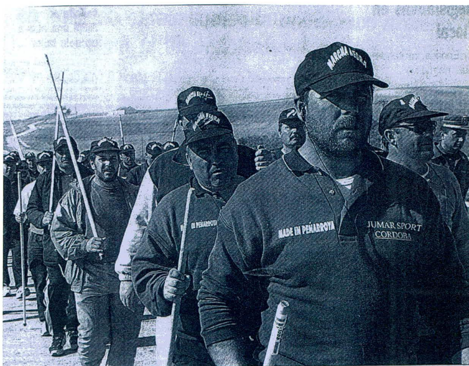
Los trabajadores de Encasur recorrieron ayer su quinta etapa, entre El Carpio y Villa del Río.