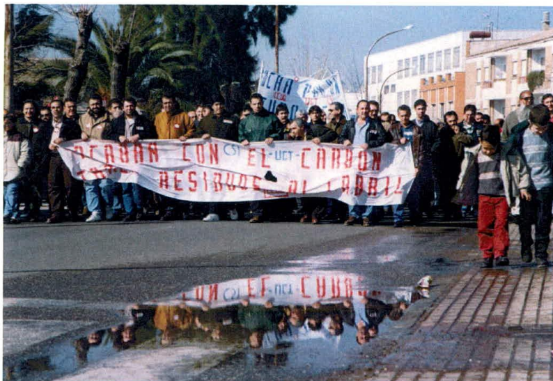
6-2-99 Manifestación en Peñarroya-Pueblonuevo contra la actuación de ENCASUR en la cuenca minera (Jerónimo López).

antigua dirección empresarial de la SMMP, a la sazón reconvertido en el bilingüe Milton Livessey College. Algunos lamentaron la tardanza en unirse para luchar por la comarca y el haber dejado que el pueblo se llenase de jóvenes prejubilados.