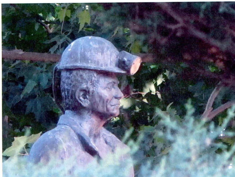
Monumento al minero en la plaza de Santa Bárbara (Jerónimo López).

activos en 1999 1 . El paro en la capital de la cuenca, Peñarroya-Pueblonuevo, llegaba hasta el 28%, según los datos de UGT, y la gente buscaba el trabajo que le negaba la agonizante minería del carbón en los invernaderos de Almería o en las fábricas de cerámica de Castellón 2 . La convicción de la necesidad de emigrar estaba tan arraigada que en los primeros días de febrero junto al monumento al minero de la plaza de Santa Bárbara colocaron una maleta y un letrero que decía “ Yo también me voy a Castellón ”.