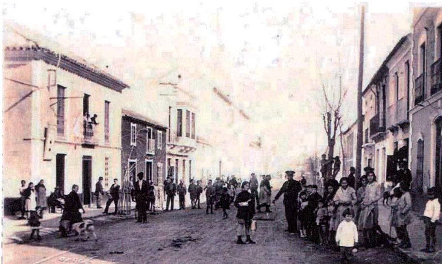
La Matallana hacia 1945.