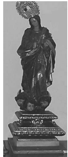
Purísima de San Sebastián 2