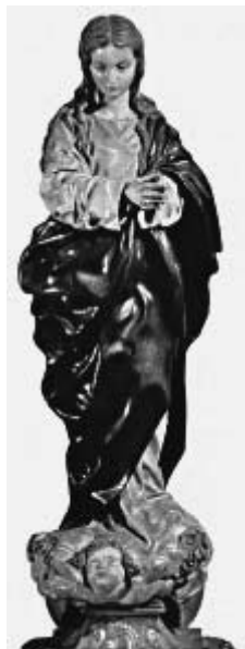
Inmaculada de Alonso Cano

Como apunte, para ilustrar esta exposición podemos decir, que las cuatro imágenes que traemos de las iglesias de Andalucía datan del siglo XVIII, igual que la desaparecida de Fuente Palmera, son bellas esculturas entre las que destacaremos a la de La Carlota por ser de mayor tamaño, aunque más pequeña que al natural, inspirada en la cieguesita de Martínez Montañez, se diferencia en la mirada que la tiene al frente y el manto lo tiene recogido en ambos hombros, San Sebastián tiene dos bellísimas imágenes, de tamaño menor que nos recuerdan a la de Alonso Cano, la patrona que preside el altar mayor, que fue restaurada cuando se construyó la nueva iglesia, no con mucho acierto pues la túnica aparece actualmente de tono