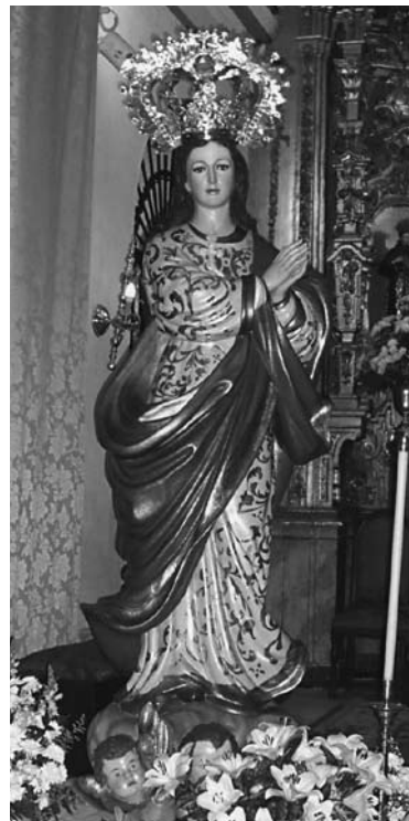
Patrona de Fuente Palmera