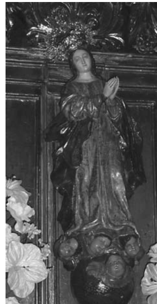
Patrona de La Luisiana