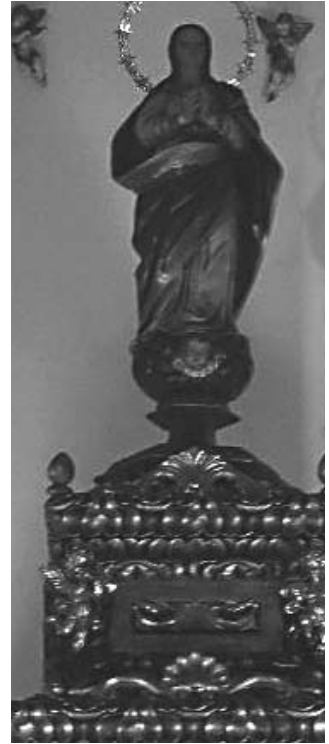
Purísima de San Sebastián

Según queda dicho, advertimos en esta obra algunos detalles propios de las inmaculadas granadinas de estirpe canesca. No obstante, y aunque los paños tienden a ceñirse en la base de la figura, adolece del marcado ahusamiento compositivo que distingue a las imágenes conceptistas salidas de los talleres de Granada. A dicha topología responde, sin duda, la pequeña talla de las Pinedas, que fue restaurada por Díaz Peno, tras la Guerra Civil, pero éste no es el caso de la pieza que nos ocupa.