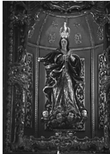
Patrona de La Carlota

Se trata de una bella pieza de tamaño menor que el natural, que efigia a María sobre un nimbo celeste del que emergen cuatro cabezas de querubines. La Virgen viste túnica beige estofada y enriquecida con decoración floral y manto azul orlado en oro y con vueltas jacinto. Los paños, como insuflados por el viento, vuelan con gran libertad lo que, unido a la diagonal formada por