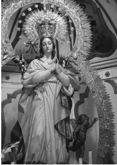
Patrona de La Carolina

verdoso, impropio de la iconografía inmaculista, también posee otra inmaculada de tamaño reducido pero preciosa que se procesiona en lugar de la patrona. Igualmente la patrona de La Luisiana es una bella imagen que parece proceder de la escuela granadina, pues la cabeza la inclina a la derecha; y la desaparecida Inmaculada de Fuente Palmera, también podría proceder de un taller de la escuela sevillana, con las manos apenas unidas a la altura del pecho. Todas las imágenes emergen de un nimbo con querubines, pero la de La Luisiana tiene un globo terráqueo y la de Fuente Palmera una luna con los picos hacia arriba. La actual patrona de Fuente Palmera, fue esculpida por Antonio Castillo Lastrucci, en 1938, es una preciosa imagen, mayor que el natural, inspirada en la anterior patrona. La Purísima de La Fuencubierta, es del último tercio del siglo XVIII y de claro aspecto rococó.