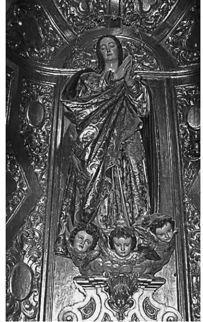
Inmaculada de M. Montañés

La imagen deriva de la bellísima “Cieguecita” de la catedral de Sevilla, en la que Martínez Montañés estableció el paradigma immaculista de los escultores sevillanos del Barroco. De aquella, conserva el desplazamiento de las manos hacía la izquierda para favorecer la visión del rostro, el escabel nuboso recamado de querubines y la disposición de las piernas: la izquierda exonerada y la derecha soportando el peso del cuerpo. No obstante, la Virgen ha perdido aquí el empaque solemne de la imagen montañesina y aquellas telas aplomadas flotan ahora animadas por la brisa berninesca que introdujo Arfe en los talleres de Sevilla, con la misma libertad que pudo permitirse Murillo, libre de ataduras que al escultor le impone la materia.