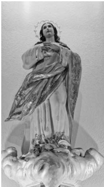
Patrona de Montizón