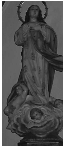
Patrona de Santa Elena