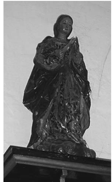
Purísima de Fuencubierta

FUENCUBIERTA. Es una imagen de claro aspecto rococó, posiblemente de un taller madrileño, tal vez del último cuarto del siglo XVIII.