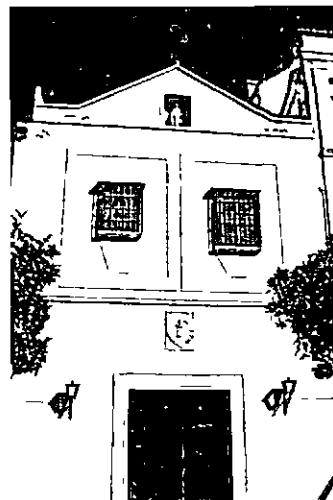
Fachada actual de la antigua iglesia conventual de Santa Teresa

Indicar, por ultimo que las funciones religiosas – ademas de las exclusivas de la comunidad 14 - se concretaban en las siguientes. El dia 19 de cada mes, se ofrecia una misa solemne en honor de San Jose. Asimismo se celebraban el mes de Maria, el mes del Rosario, los siete domingos a San Jose, un quinario dedicado Nuestro Señor Jesucristo Crucificado y anualmente una fiesta al Corazon de Jesus y otra al Dulce Nombre de Maria, asi como una novena a la Purisima Concepcion. Todas estas celebraciones religiosas estaban a cargo de los sacerdotes de la parroquia