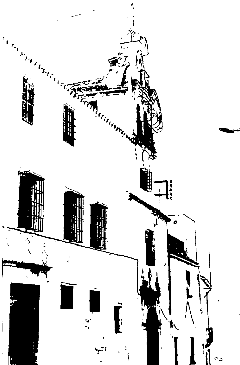
Portada de la iglesia de San Miguel y Convento antes de su reciente remodelacion