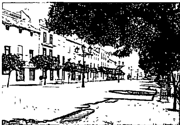
Paseo de Andalucia. Al fondo, la ermita de Ntra Sra de la Cabeza

otra parte, los muros contiguos al retablo se decoraban con "seis cuadros de regulares dimensiones pintados, que representan los tres de la derecha a San Jeronimo, un Religioso y el Señor Amarrado a la Columna, y los tres de la izquierda, la Asuncion, Santa Teresa y Jesus muerto en los brazos de su Madre'. A la diestra del altar mayor, en el muro aparecia practicado un hueco "guarnecido de madera tallada' con la imagen de San Elias: talla de madera de dimensiones "como de tamaño natural'.