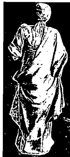
La Abundancia. MAECO. Dorso.

En todo caso hoy estamos en condiciones de afirmar que no se trata de una representación de María con el Niño, sino más bien de la Abundancia. Eso sí, puesta en clave popular, ya que a diferencia de cómo estamos acostumbrados a ver las alegorías de la Abundancia de tipo culto, es decir, como figura femenina acompañada del mitológico cuerno repleto de frutos de la tierra, aquí