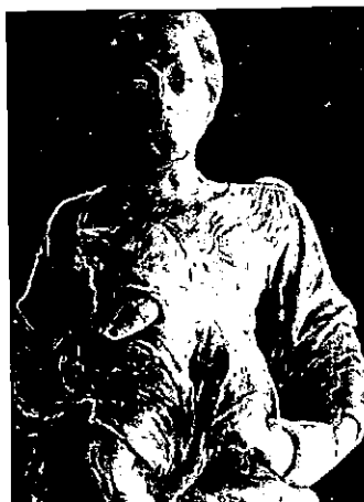
La Abundancia. MAECO. Detalle.