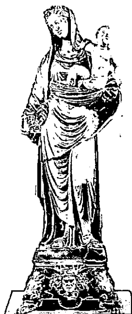
Agostino Busti: Virgen con Niño. 1522. Museo Sforzesco. Milán

el cabello, peinado con raya central hacia atrás, extendiéndose hacia la parte inferior recogido con otra fibula que lo desarrollará en suerte de cola de caballo. Con todo ello, no cabe duda de que se trata de un personaje femenino aditado con finos adornos, es decir, fibulas de piedras preciosas o camafeos, que presenta según era moda entre las mujeres romanas de la época del Imperio.