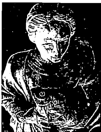
La Abundancia. MAECO. Detalle.

Como detalles más característicos va a presentar dos fíbulas o brochecillos que le ajustan el fino quitón por encima del pecho a la altura del hombro, exhibiendo idéntico peinado que la nuestra, en este caso tapado hacia la parte trasera por un velo que le nace del manto, por lo que estamos ante una suerte de dama velada desprovista de todo atributo 8 .