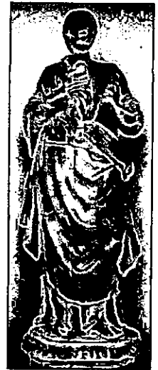
Supuesta Virgen con Niño. Museo Arqueológico y Etnológico de Córdoba. Siglo XVII. primer cuarto.

En ella es considerada además por el ilustre arqueólogo como del periodo o estilo renacentista, y como obra perteneciente a la escuela sevillana, preguntándose si acaso no habría estado situada en la fachada de una iglesia de Hornachuelos, que quizá no hubiese podido ser otra que la llamada de la Santa Caridad 2 , considerando que,