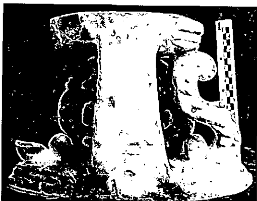
La Abundancia. MAECO. Dorso del pedestal.

Dicho pedestal, de considerable fragilidad si lo comparamos con el volumen del resto de la pieza, está hueco por dentro y va decorado en su cara frontal, a modo de escudo, por una venera rodeada de motivos vegetales y flores, que se remata en corona real. En su cara inferior aparece escrito a lápiz grafito, el antiguo número de registro que poseía el conjunto de la pieza, "625". Su diseño y concepto decorativo es muy similar al que presentan diversas piezas italianas de ese momento, como la conocida Inmaculada del tesoro de la Catedral de Córdoba, o diversas obras que efigian a la famosa Madonna de Trápani , salidas recientemente al mercado.