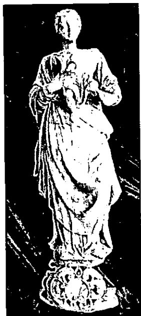
La Abundancia. MAECO. Imagen completa.