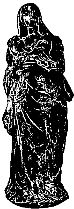
La Abundancia. Museo Municipal de Madrid.