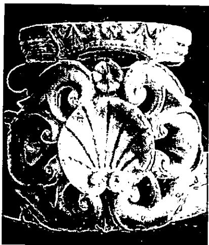
La Abundancia. MAECO. Frente del pedestal.