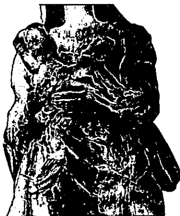
La Abundancia. Museo Municipal de Madrid. Detalle.