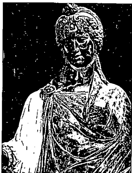
Nicolás Cordier. La Gitanilla. Hacia 1607-12. Roma. Villa Borguese.

lo que también su polivalencia o multisignificado estaba asegurado. Valga como ejemplo la alegoría de La Caridad que realiza hacia 1600-02 el escultor Nicolás Cordier (1565-1612) con destino a la parte inferior del Mausoleo de Luisa Aldobrandini en la Iglesia romana de Santa María Sopraminerva, formada por una mujer acompañada de varios niños sin ningún otro aditamento significativo.