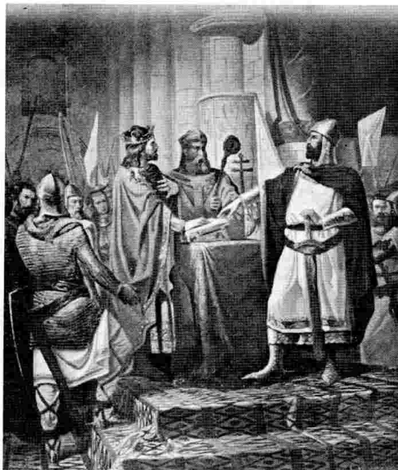
LA ZUJIA DE SANTA BAUEA (AÑO 1072)