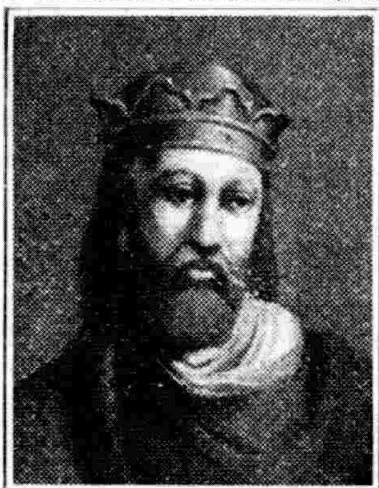
ALFONSO VI (1072 a 1109)

Como testigos del acto estaban el Obispo Don Gómez, los cargos más representativos del famoso monasterio burgalés, las damas y pajes de la corte, el valiente Rodrigo Díaz de Vivar llamado el Cid Campeador acompañado de su mujer doña Jimena.