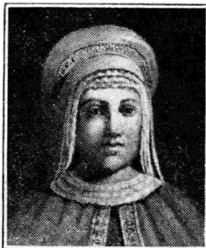
DOÑA URRACA (1109 a 1126)

Igualmente estaban presentes los Condes de Lara, los infantes de Carrión, Pedro Ansúrez con sus hermanos Gonzalo y Fernando, el conde Enrique de Borgoña yerno del rey casado con su hija Teresa, Condes de Lusitania.