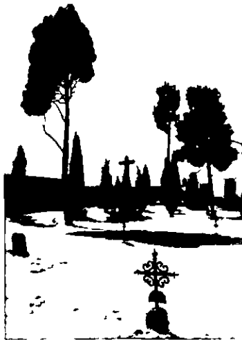
Interior del Cementero de Anora

La obra ocupara un terreno rectangular de 60 metros de longitud y 50 de anchura, con una extension total de 3 000 m 2 Atendiendo a las defunciones ocurridas en la localidad en los ultimos veinte años, Castiñeyra calcula la superficie necesaria para las sepulturas en tierra y estima que 400 m 2 pueden dedicarse a paseos 11 La construccion de nichos adosados a los muros, autorizada y regulada por re-